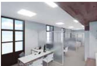
APROVADES LES SUBVENCIONS DEL PLA XARXA