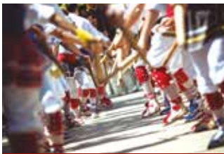
FESTA MAJOR A CANTALLOPS