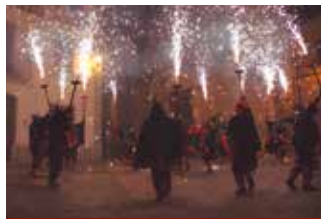
LES MILLORS IMATGES D'UN ESTIU DE FESTA