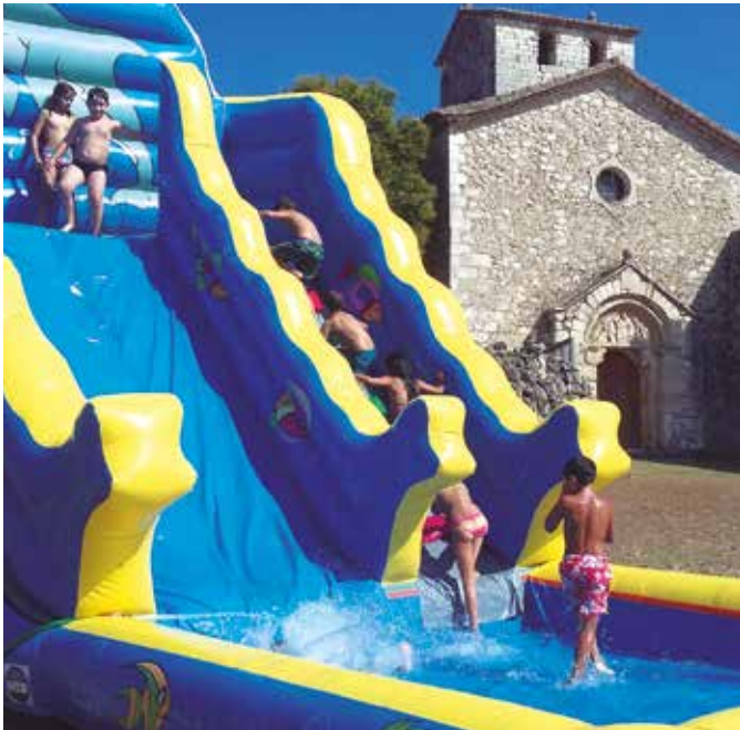
Sant Sebastià dels Gorgs