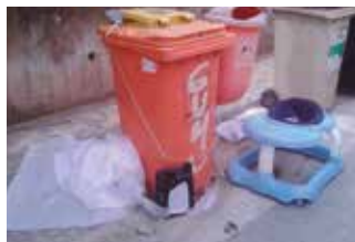
SIGUEM NETS, AMB LES DEIXALLES ENCARA MÉS