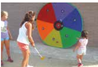
CASAL D'ESTIU 2016