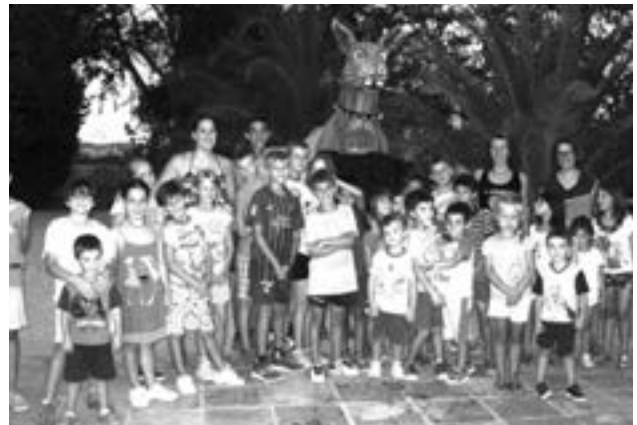
Les Colònies a l'Illot Gran