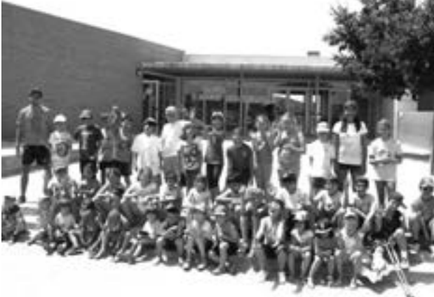
Holly Festival al Casal d'estiu

Els mesos de juny, juliol i agost va tenir lloc el Casal d'estiu del nostre municipi. Enguany, responent a les peticions de moltes famílies el casal va augmentar la seva franja horària, les setmanes de durada (varen ser set setmanes) i el format de les inscripcions que es va poder fer per setmanes. També s'hi va afegir el servei d'acollida de les 7'45 a les 9 del matí. La valoració del casal d'estiu 2015 ha estat molt positiva i moltes de les famílies així ens ho han fet saber. Des de l'Ajuntament volem agrair a les famílies el suport i la confiança en el Casal d'estiu que ens fan cada any.