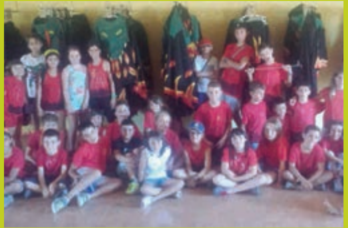
Diablers de les Gunyoles