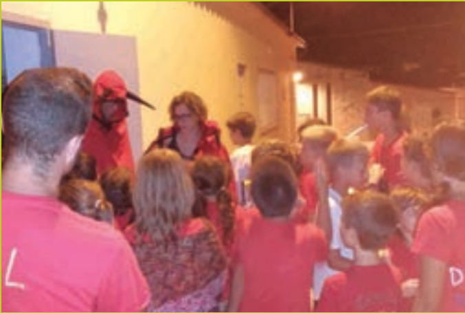
Diablers de l'Arboçar