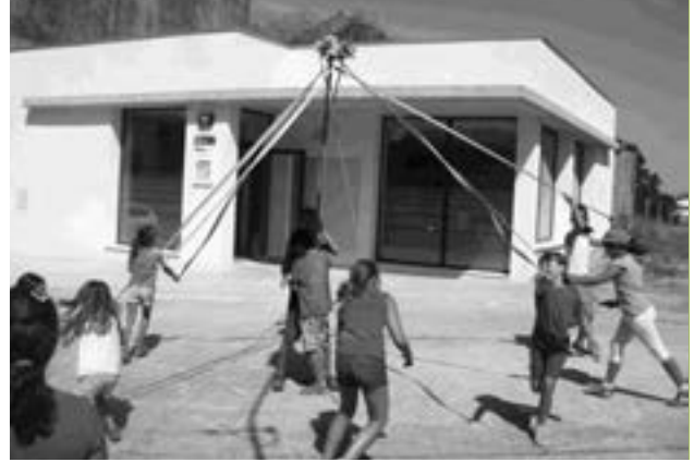
Aprent el Ball de Cintes a Cantallops

Els mesos de juny, juliol i agost va tenir lloc el Casal d'estiu del nostre municipi. Enguany, responent a les peticions de moltes famílies el casal va augmentar la seva franja horària, les setmanes de durada (varen ser set setmanes) i el format de les inscripcions que es va poder fer per setmanes. També s'hi va afegir el servei d'acollida de les 7'45 a les 9 del matí. La valoració del casal d'estiu 2015 ha estat molt positiva i moltes de les famílies així ens ho han fet saber. Des de l'Ajuntament volem agrair a les famílies el suport i la confiança en el Casal d'estiu que ens fan cada any.