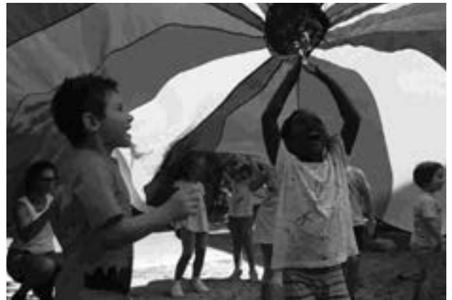
Sortida Jornada Esportiva a Vilafranca