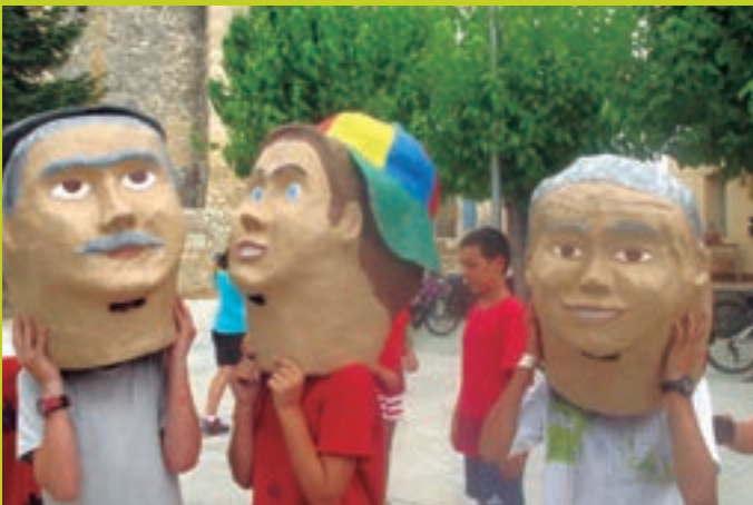
Els Capgrossos a Sant Sebastià