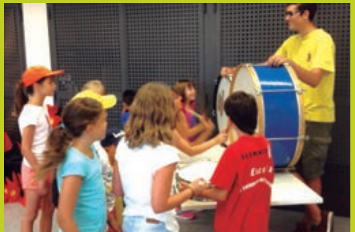
Timbals dels diablers Nefastus a Avinyó Nou