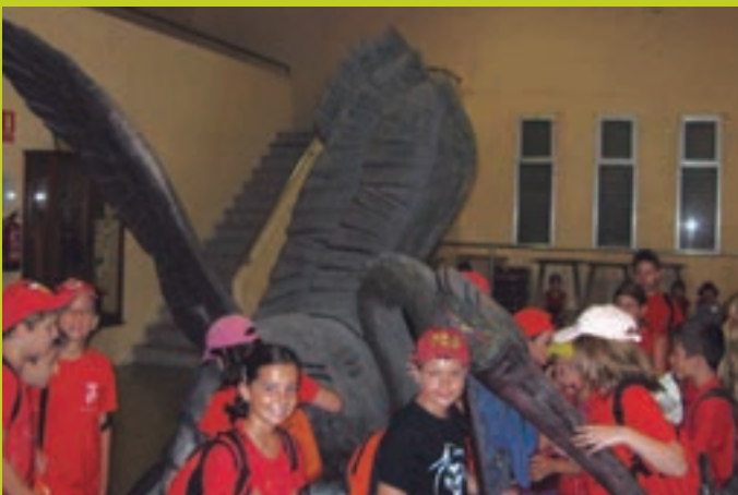
La Segunola a les Gunyoles