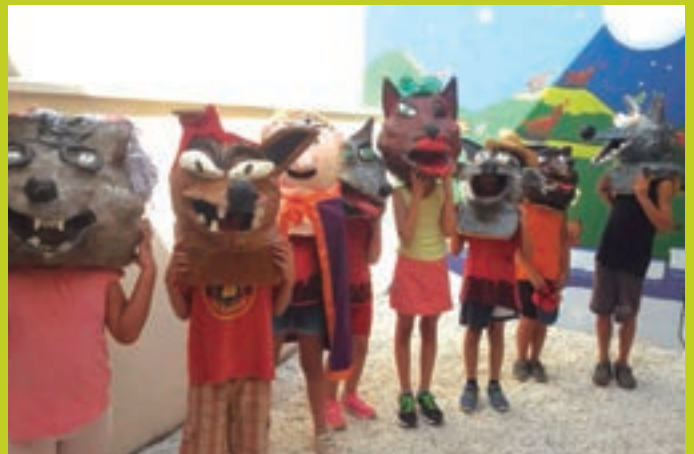
Els Llobatons a Cantallops