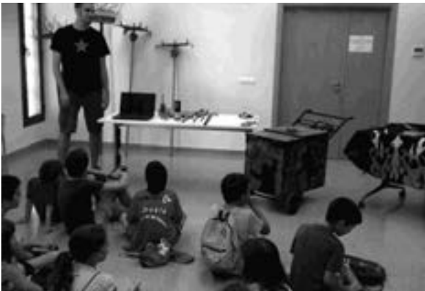
Nefastus d'Avinyó Nou