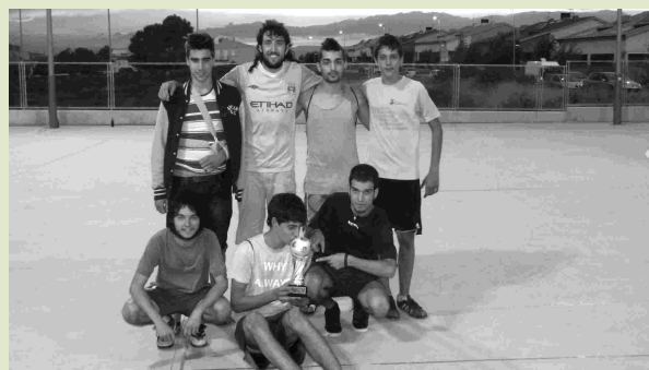
Elegància al Pulmó