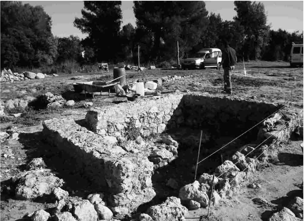
Treballs de consolidació al recinte

La primera intervenció de consolidació o restauració arqueològica al Turó de la Font de la Canya es va dur a terme el passat mes de desembre de 2011.