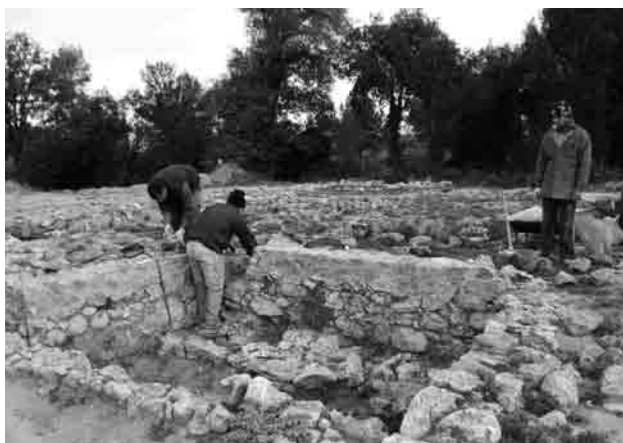
Treballs de consolidació al recinte

Amb aquest objecte des d'un primer moment s'han conservat i acumulat moltes de les pedres que apareixen en el procés d'excavació.