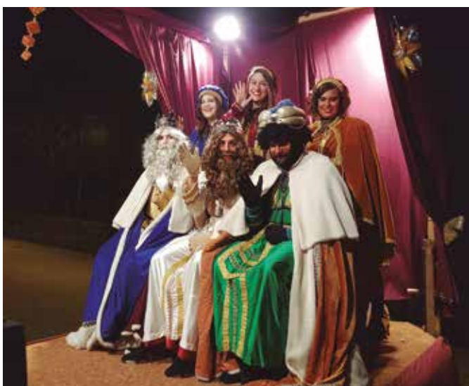
Reis Mags a les Gunyoles (Societat La Torre)