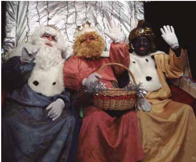
Cavalcada a Cantallops (CCR Cantallops)