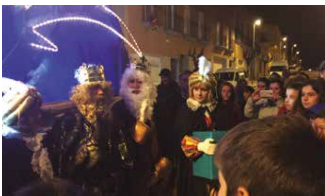
Els mags d'orient, a Avinyó Nou (CCR La Parra)