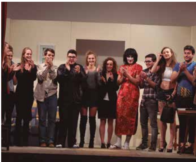
Vetllada nadalenca i visita reial a l'Arboçar (societat La Penya)