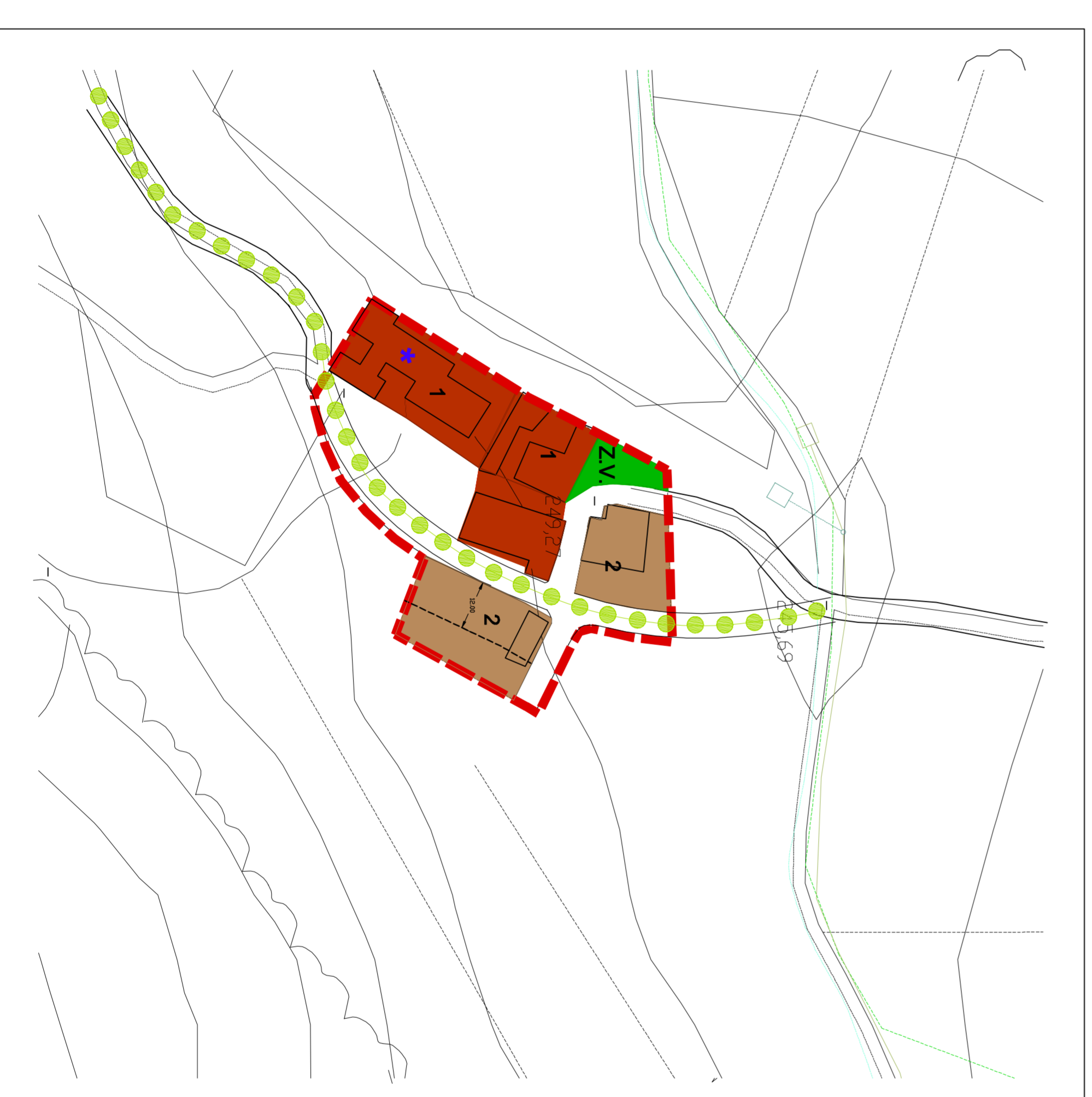
ARBOÇAR DE BAIX